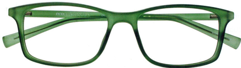
Eco Biobased: Ein Leichtgewicht in klassischen Farben und modernen Formen.

Eco Biobased ist von der amerikanischen Aufsichtsbehörde, der USDA (United States Department of Agriculture) zertifiziert. Die Brillenfassungen sind antiallergisch.